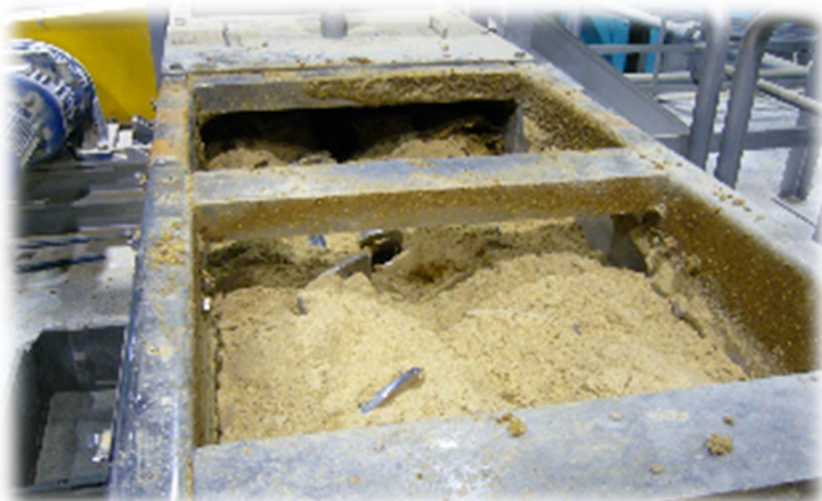
焼酎粕(麦糠+ケーキ+濃縮液)均一に混合