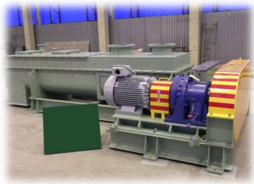
ダウミキサー外観